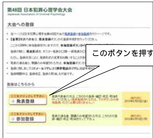
【エントリーページ】